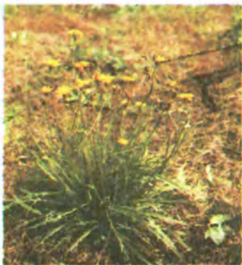
624. Любочки осінні.